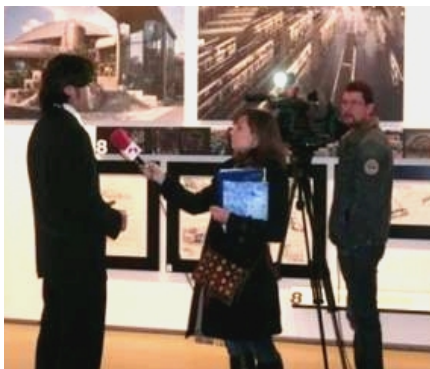
Entrevistas en Museo ICO (Instituto de Crédito Oficial)