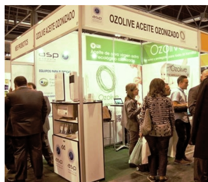
Ozolive en la Feria Biocultura