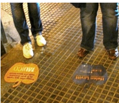
Street Marketing Museo ICO