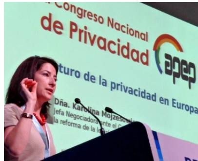
Congreso Nacional de Privacidad APEP