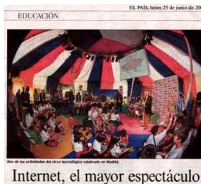
Evento Internet Chaval.es (Red.es)