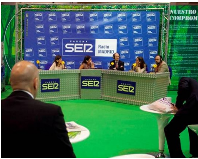
Espacio Open Green de la EOI