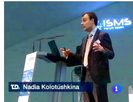
Jornadas Internacionales de Seguridad de la Información (ISMS Forum)